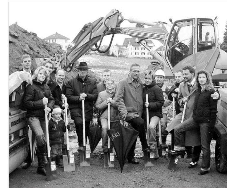
Mitte Januar wurde mit den Bauarbeiten der Erschliessungsstrasse Hohenbühlweg begonnen. Gleichzeitig erfolgte im Beisein von Käufern und Verantwortlichen der obligate Spatenstich.

Sechs Einfamilienhäuser sind bereits verkauft, und drei weitere von insgesamt 13 Eigenheimen sind reserviert. Exklusives Wohnen in der aufstrebenden und attraktiven Gemeinde Freidorf mit einem intakten Dorfleben scheint begehrt zu sein.