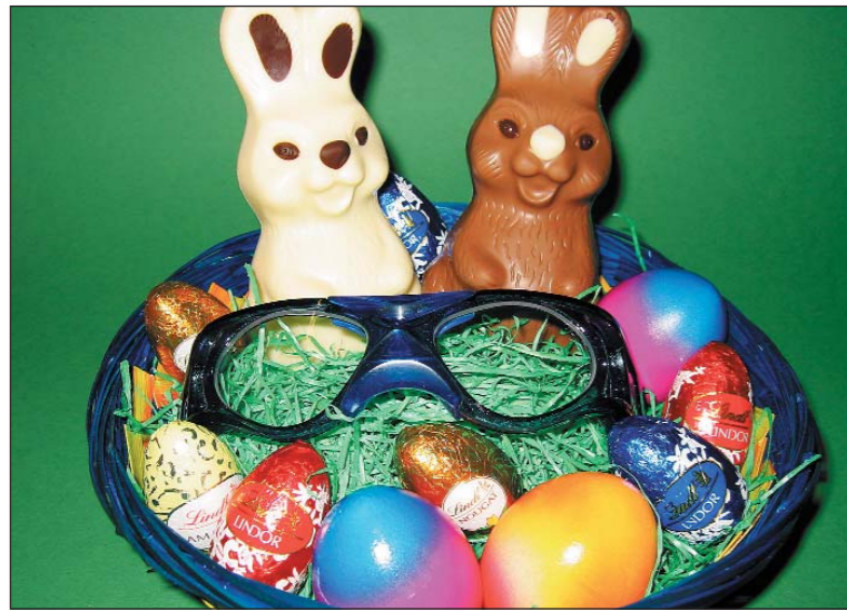
Varilux Physio ist das neue Gleitsichtglas von Essilor neuester Technologie mit bestem Sehkombi.

Hablützel-Optik ist neu einer von 30 Sportoptikern in der Schweiz. Mit der Firma Sciols aus München hat das Optikfachgeschäft einen innovativen Partner im Bereich Sportoptik gefunden. Mit der Aussage «Wir verkaufen keine Sportbrillen sondern Sportgeräte» setzt Sciols neue Massstäbe in Sachen Sportbrillen. Die neuen Sportbrillen werden speziell und individuell auf eine Sportart angepasst. Funktionalität und die beste Sicherheit für die Augen sind dabei oberstes Gebot. Die Brillenglasstärke kann in