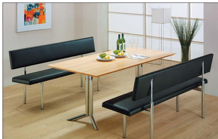
An der Frühlingsmesse begegnen Ihnen E. + K. Käppeli am Tisch. Ein Beispiel des genüsslichen Tafelns zeigt dieses Bild. Aber nicht nur Tische und Stühle, sondern auch passende Side- und Highboards auf Mass runden das Messe-Angebot ab. Sollte Ihnen ein ganz aussergewöhnlicher Vitrinenschrank auffallen, so wird Ihnen das Team am Messestand gerne mehr darüber erklären. Oder wissen Sie schon, was Feng-Shui-Möbel sind?