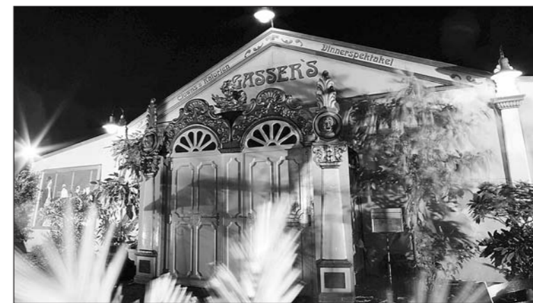
«Clowns & Kalorien» bietet in Arbon noch bis zum 26. Mai ein Ambiente, das zum Träumen, Schlemmen und Lachen einlädt.