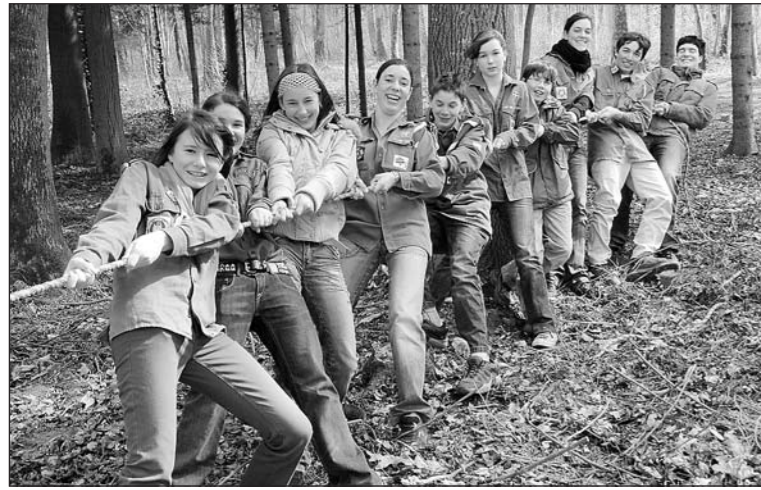
Die aufgestellten Cevi-Leiter freuen sich auf zahlreiche Anmeldungen.