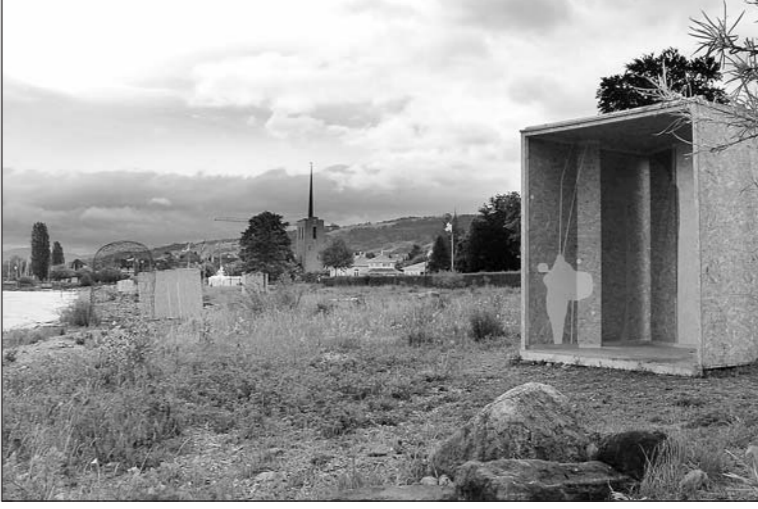
«Strandgut» – ein einmaliges Kunstprojekt für Kultur und Begegnung.