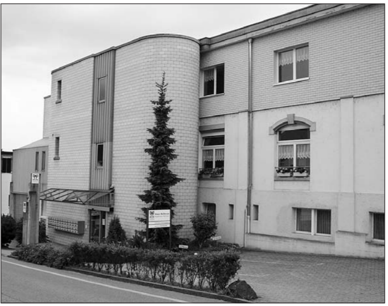
Wird das Haus Bellevue den Status eines Pflegeheims bekommen?

Der Stadtrat Arbon lädt die Organi- sationen Pflegeheim Sonnhalden, Evang. Alters- und Pflegeheim und die Genossenschaft Alterssiedlung ein, gemeinsam mit der Stadt Arbon die Angebote weiter zu entwik- keln und verschiedene Projekt- gruppen zu bilden. Im Vordergrund stehen aus Sicht der Stadt ein weite- res Pflegeheim, eine Station für Demenzranke und der Ausbau im Betreuten Wohnen sowie im ambu- lanten Dienstleistungsbereich.