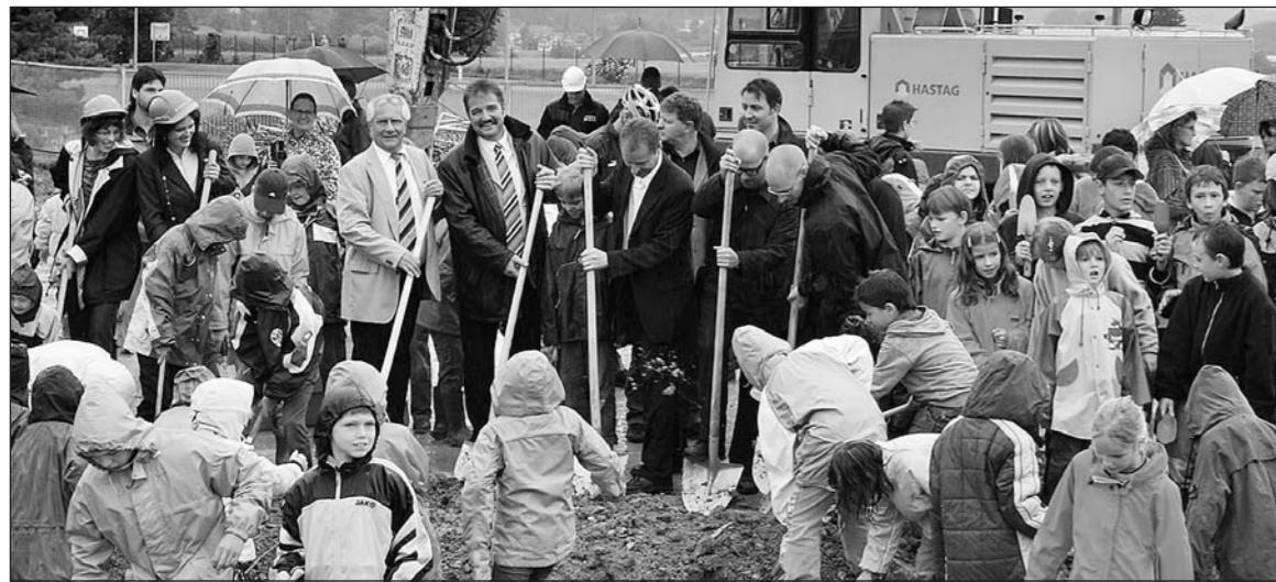
Mit dem Spatenstich wurden die Bauarbeiten für die Erweiterung der Steinacher Schulanlage mit dem Neubauprojekt «Serafina» offiziell begonnen. Der voraussichtliche Bezugstermin wird auf Herbst 2008 geplant.

«Eine Schule als Lebensraum für eine bestmögliche Schulzeit als Basis für die Zukunft» wollen die Architekten Gut Deubelbeiss AG aus Luzern den Steinacher Schulkindern bauen. Eingeweiht werden soll das 11-Mio.-Projekt «Serafina» voraussichtlich im Herbst 2008.