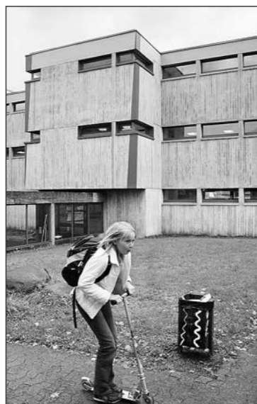
Die beiden Schulhäuser Bergli (links) und Stacherholz können gemäss neuem Kommunikationskonzept eigene Erscheinungsbilder entwickeln.