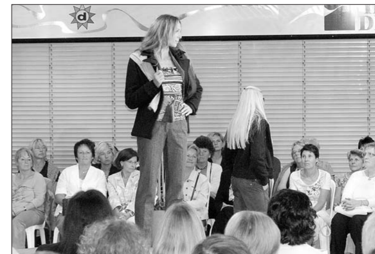
Das Marken-Sortiment von Bonsaver Mode bietet beste Qualität in einem fairen Preissegment. Auf zwei Etagen werden in den Konfektionsgrössen 34 bis 48 drei Mode-Stil-Welten präsentiert.

Die Mode für den kommenden Winter präsentiert sich spielerisch, ideenreich und vielseitig. Davon konnten sich bei Mode Bonsaver in Arbon kürzlich rund 300 Modebegeisterte eindrücklich überzeugen.