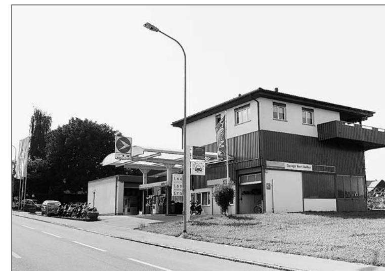
Als unabhängiger Betrieb kann die Garage Koller an der St.Gallerstrasse 20 in Freidorf dank der Zusammenarbeit mit «le Garage» alles bieten, was die Kundschaft von einer modernen Garage erwartet.

32 Jahre lang war die Garage Koller in Freidorf Renault-Vertreterin, doch nun wagt der alteingesessene Familienbetrieb einen Neuanfang mit dem markenunabhängigen Garagekonzept «le Garage».