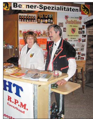
Arwa-Premiere des Berner-Vereins.