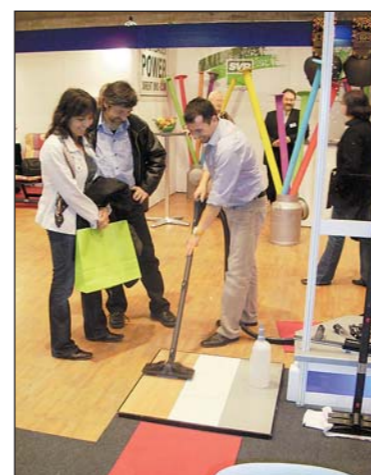
So einfach kann putzen sein!