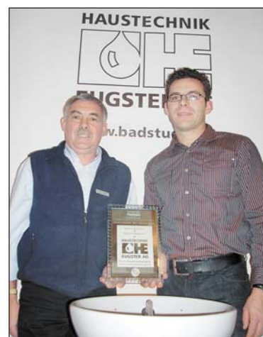
Stolze Unternehmer des Jahres.