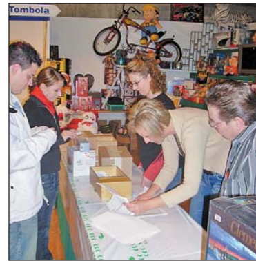
Glück gehabt an der Tombola...