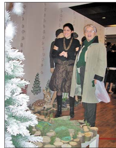
Wollige Schnäppchen bei Filati.