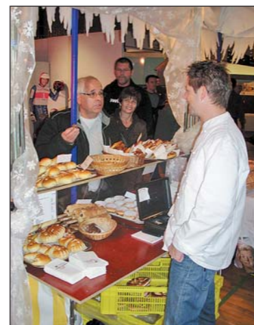
Kundschaft beim Roggwiler Beck.