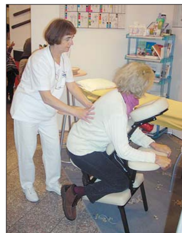
Vorbeugen ist besser als heilen.