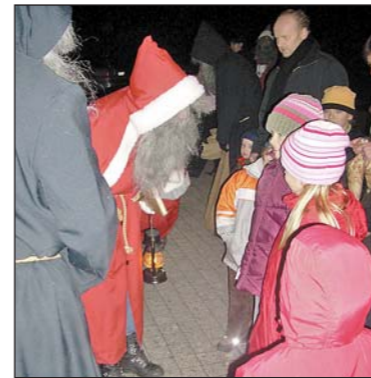
De Samichlaus chunnt...