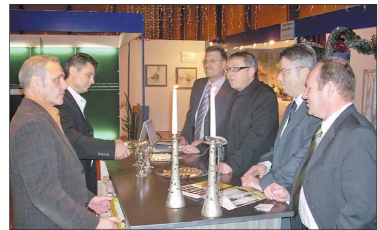
Die regionale Politik zu Gast bei den Malermeistern der Frenicolor GmbH.