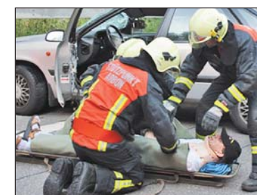
Bergung des PW-Lenkers.