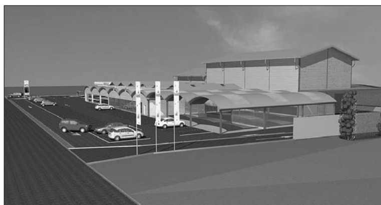
Das Neubau-Konzept des Landi-Marktes in Mallisdorf beinhaltet 1000 Quadratmeter beheizte Verkaufsfläche, 360 Quadratmeter gedeckte Verkaufsfläche und 180 Quadratmeter überdachte Verkaufsfläche.

Rund 7,6 Mio. Franken kostet der Landi-Markt mit Agrola-Tankstelle, welcher im Frühling 2009 auf dem Grundstück Pünt an der Hauptstrasse von Arbon nach Neukirch beim Autobahn-Zubringer Arbon-West eröffnet werden soll. Der Flächenbedarf für das ganze Grundstück umfasst rund 6400 Quadratmeter.