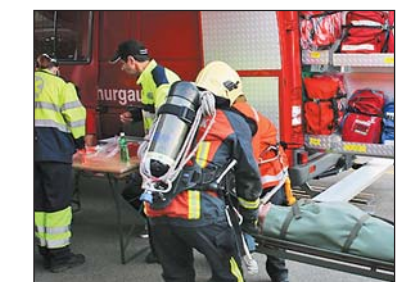
Anlieferung bei der Sanität.