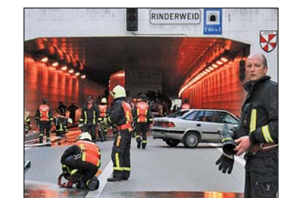
Nach der Hektik das Aufräumen!