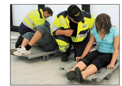
Opfer mit Rauchvergiftung.