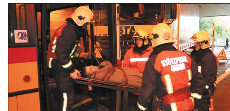
Ein Unfallopfer wird auf der Bahre aus dem Reisebus getragen.