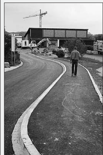
Der Steinacher Hafen erhält mit der Wohnüberbauung «Steinacherhof» eine nach ihm benannte Strasse.

Steinach hat eine neue Strasse mit aussagekräftigem Namen: die Hafenstrasse. Sie ist Verbindungsstück zwischen der Hauptstrasse (Höhe Hafen) und der projektierten Wohnüberbauung «Steinacherhof». Mit der Fertigstellung der Hafenstrasse Steinach ist eine der letzten grossen Baulandparzellen der Gemeinde Steinach, das Gebiet «Steinerbummert», erschlossen. Hier entsteht bis 2010 in Etappen eine Wohnüberbauung mit rund 50 Eigentumswohnungen. Mit den Bauarbeiten für den «Steinacherhof», so der Name des Projekts, soll im Herbst 2008 begonnen werden. Der «Steinacherhof» ist ein wichtiges Projekt für Steinach. «Es ermöglicht Leuten, an einer exklusiven Lage moderne und komfortable Eigentumswohnungen zu erwerben. Die Nähe zum Hafen, der gute Steuereffekt und das idyllische Dorfleben machen diese Wohnungen sehr attraktiv», sagt Roland Brändli, Gemeindepräsident von Steinach. So leben die zukünftigen Bewohner des «Steinacherhofs» an der Hafenstrasse und geniessen neben einen einmaligen Blick auf den schmucken Steinacher Hafen – auch jenen zum Säntis. Realisiert wurde die Hafenstrasse von der Baugesellschaft «Steinacherhof». Sie geht mit der offiziellen Beschilderung an die Gemeinde Steinach über. mitg.