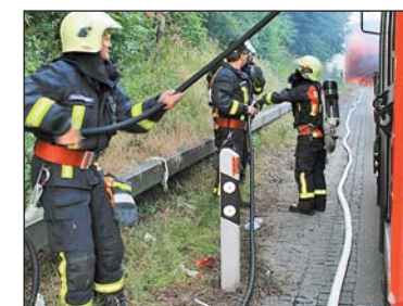
Brand im Tunnel: Es eilt!