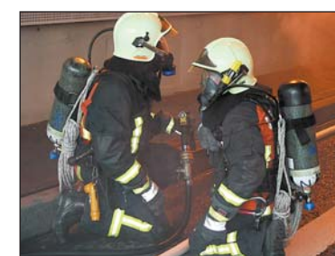
Mit Atemschutz im Tunnel.