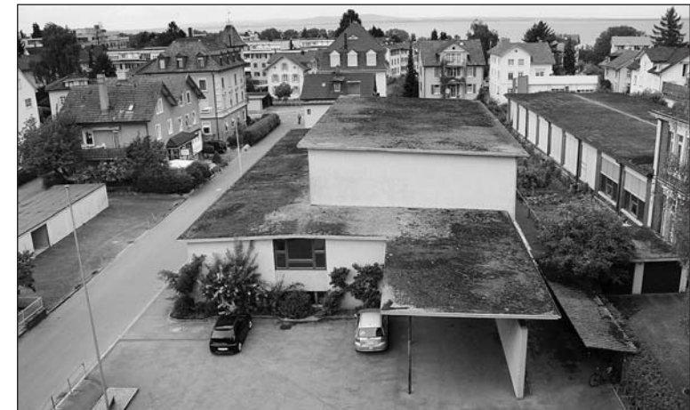
Anstelle der abbruchreifen Doppeltturnhalle beabsichtigt die Primarschulgemeinde Arbon an der Sämtisstrasse den Bau einer Einfachturnhalle.

Kein Zweifel! Die Arboner Sämtisturnhalle befindet sich in einem dermassen desolaten baulichen Zustand, dass ein Abbruch unumgänglich ist. Deshalb läuft derzeit ein Projektwettbewerb für eine neue Einfachturnhalle, die ab Juli 2009 gebaut und im August 2010 in Betrieb genommen werden soll.