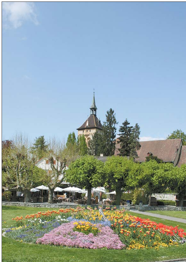
Visitenkarte vom Arboner Hafen aus!