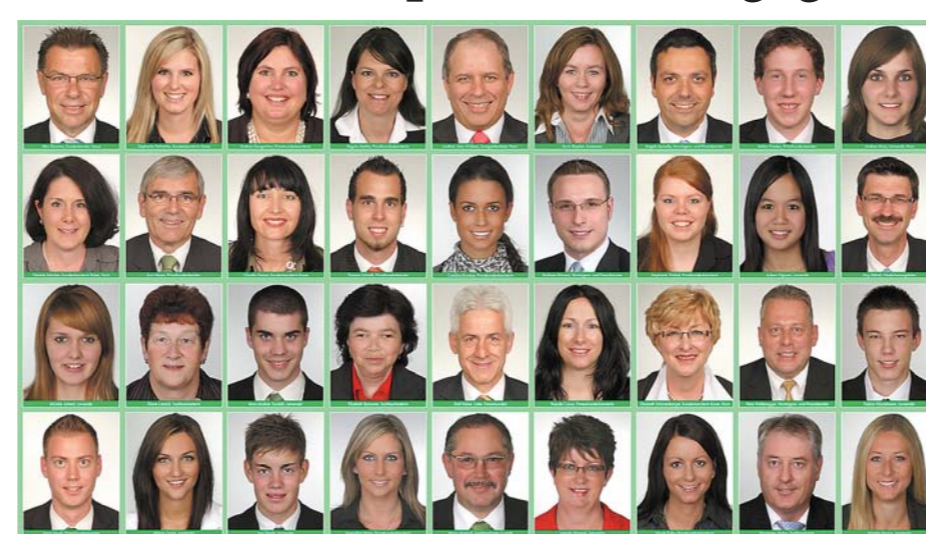
Die Mitarbeitenden der TKB Arbon und Horn bieten Bankdienstleistungen aus einer Hand an.

ner, der diesen Betrag voll ausschöpft, darf im Folgejahr mit Steuerersparnissen von 1500 bis 2000 Franken rechnen. Steuerfrei sind bei dieser Sparform auch der Zins sowie der Zinseszins. Gleichzeitig entfällt die Vermögenssteuer. Erst bei der Auslösung des Kapitals wird eine reduzierte Steuer fällig. Selbstständigerwerbende ohne Anschluss an eine Pensionskasse dürfen bis zu einem Betrag von 32 832 Franken oder maximal 20 Prozent ihres AHV-pflichtigen Netto-Einkommens in die dritte Säule einzahlen.