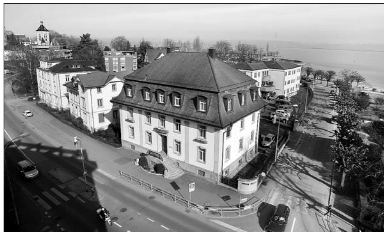
Auf den 1. Januar 2011 will der Kanton Thurgau von der Arboner EKT Holding AG (Bild) ein Aktienpaket in Höhe von 30 Mio. Franken übernehmen.

Auf den 1. Januar 2011 erwirbt der Kanton Thurgau von der EKT Holding AG in Arbon ein Aktienpaket von 30 Millionen Franken an der Axpo Holding AG. Das entspricht zwei Dritteln des Thurgauer Axpo-Aktienpakets, das bisher in der alleinigen Hand der EKT Holding AG war. Die Aktienübernahme erfolgt mittels eines Darlehens mit einer Laufzeit von zehn Jahren.