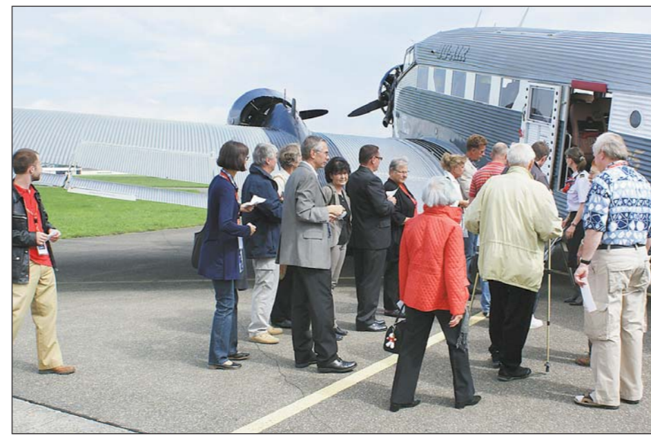
Spannung bei den geladenen Gästen: Bald hebt die «Ju 52» zum Alpenrundflug ab.

Geschichte des Unternehmens Im Geschäftsbereich SATAG Thermotechnik arbeiten rund 40 Mitarbeiter und Mitarbeiterinnen, vom Aussendienst bis hin zu den Lehrlingen. Die genaue Bezeichnung des Kompetenzzentrums für Wärmepumpen lautet Viessmann (Schweiz) AG, Geschäftsbereich SATAG Thermotechnik. Die SATAG beschäftigt sich unter anderem mit folgenden Aufgaben: Entwicklung, Engineering, Vertrieb und Service von Wärmepumpen und Warmwasserwärmepumpen Natura und Vitocal. 1980 war der Beginn des Wärmepumpenbaus, damals noch in der SAURER Gruppe Abteilung Thermotechnik. Zu dieser Zeit wurden die Wärmepumpen mit analogen Reglern bedient. 1992 löste sich die Abteilung Thermotechnik von der SAURER Gruppe, und einige Mitarbeiter gründeten die SAURER Thermotechnik AG. Gleich im Anschluss wurden die ersten Wärmepumpen mit digitaler Regeltechnik gebaut. Es folgte eine Änderung des Firmennamens. Neu hiess das Unternehmen SATAG Thermotechnik AG (SAURER Thermotechnik AG). 1998 erfolgte der Eintritt in die Viessmann Gruppe und SATAG wurde zum Kompetenzzentrum für Wärmepumpen für die Viessmann Gruppe. 2004 wurde die eigene Aktiengesellschaft SATAG Thermotechnik AG aufgelöst; daraus resultierte der heute bekannte Name Geschäftsbereich SATAG in der Viessmann (Schweiz) AG. Der Geschäftsbereich SATAG ist einer der führenden Wärmepumpenhersteller der Schweiz und präsentiert sich vom 7. bis 17. Oktober an der Olma in der Halle 1 am Stand 1.1.10.