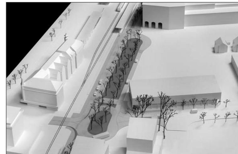
Das Projekt der NLK ist definitiv ausgearbeitet. Die neue Stadtmitte bildet die städtische Drehscheibe für öffentlichen und privaten Verkehr.

Gemäss Max Gimmel, Präsident der vorberatenden Kommission des Stadtparlamentes, ist das Projekt NLK ein Mobilitätskonzept, das die einmalige Chance bietet, sämtliche Problemstellungen dieser Mobilität in einer umfassenden Lösung anzupacken, wobei der Fokus nicht allein auf eine Strasse gerichtet ist. Das Konzept ermögliche der Stadt eine sinnvolle Entwicklung, ohne dass die Lebensqualität sinke.