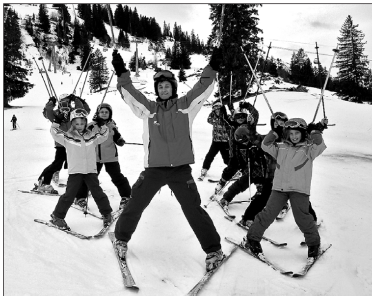
Die Ski- und Snowboardkurse der Schneesportschule des KTV Arbon konnten in Wildhaus unter besten Bedingungen durchgeführt werden.

Zum 54. Mal hat die Schneesportschule des KTV Arbon ihre traditionellen Ski- und Snowboardkurse unter besten Bedingungen in Wildhaus durchgeführt. Die drei Kurssonntage waren ein voller Erfolg.