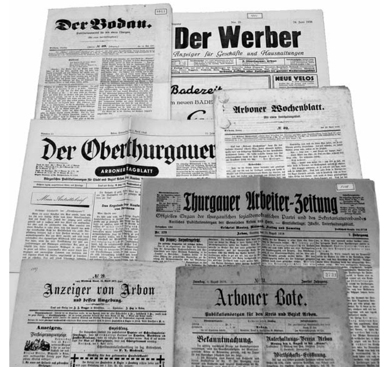
Vielseitige Vergangenheit: Arboner Blätter im Jahrhundert-Rückblick.

Zwei markante Verleger Sein Nachfolger, der «Anzeiger von Arbon und Umgebung», der in Weinfeld, später in Romanshorn gedruckt wird, hält sich bis 1880, vielleicht auch länger. Von 1877 bis 1977 – vorübergehend von 1919 bis 1929 umgetauft in «Arboner Tagblatt» – ist «Der Oberthurgauer»