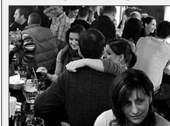
Ein Gang ins «Jacks» lohnt sich an diesem Jubiläumswochenende ganz besonders. Special-Drinks und DJ's dürften die Gemüter schnell erwärmen und die Stimmung zum Kochen bringen.

Pünktlich zu den wärmeren Temperaturen im Frühling widmete man sich im «Jacks» vermehrt der Gemütlichkeit. Die neue Gartenlounge inklusive Outdoorbar lud an lauen Sommerabenden zum Feierabendbier oder zum WM-«Public Viewing» mit Freunden ein. Knurrte der Magen eines Gastes, konnte man einfach genüsslich im Loungesessel sitzen bleiben und sich Grilladen, einen Snack oder ein Eis bestellen. – Wichtiger Hinweis: Ab der Wassergasse 1 in Richtung «Jacks» besteht ab 22 Uhr ein Nachtfahrverbot. Die Gäste werden gebeten, die öffentlichen Parkplätze auf der gegenüberliegenden Seite oder beim Seeparksaal zu benutzen. Das «Jacks» ist Mittwoch bis Samstag ab 17 Uhr geöffnet.