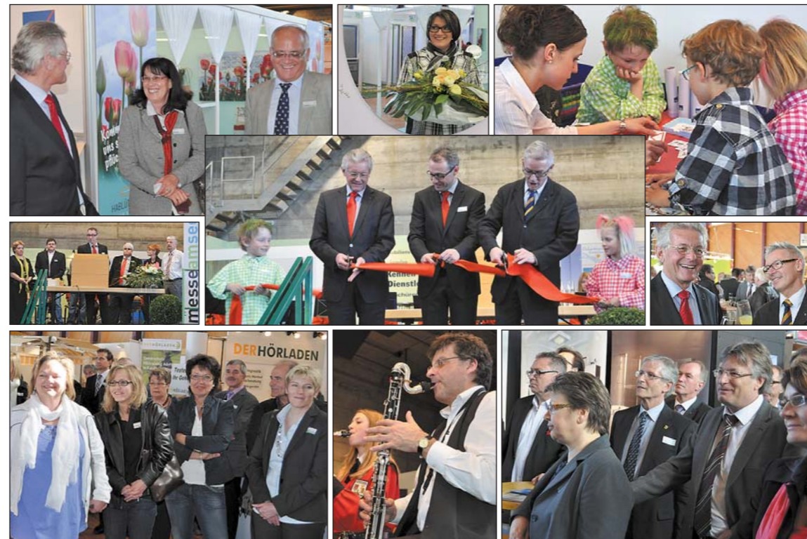
Die «Messe am See» ist zwar erst zwei Tage geöffnet, doch allseits sieht man bei Besuchern zufriedene Gesichter.