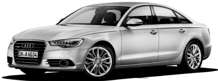
Aktueller Stolz der Elite Garage Arbon AG: die neue Audi-A6-Limousine.

Gleichzeitig mit der «Messe am See» lädt die Elite Garage Arbon AG morgen Samstag und am Sonntag, 2./3. April, von 10 bis 17 Uhr an die Romanshornstrasse 58 in Arbon zur Frühlingsausstellung ein. Dabei wird einiges geboten: die schweizweit exklusive Markteinführung der neuen Audi-A6-Limousine, die Präsentation des neu gestalteten Audi-Showrooms und der Direktannah-