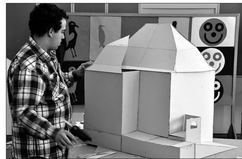
Projektwoche im Schulzentrum Reben 25 Im Sekundarschulhaus Reben 25 wurde während einer Woche intensiv geholt, genäht, gebastelt, getanzt, gestrickt, programmiert und recherchiert und vieles mehr. Während der Projektwoche der 3. Klassen widmet sich jede Schülerin und jeder Schüler einem eigenen Projekt. Die Planung wurde von der Idee bis zum Detail selbstständig durchgeführt. Am Ende der arbeitsamen Woche haben alle ihr Ziel erreicht und so konnten sie ihr selbst erstelltes Produkt an einer Ausstellung den Eltern und Mitschülern präsentieren.