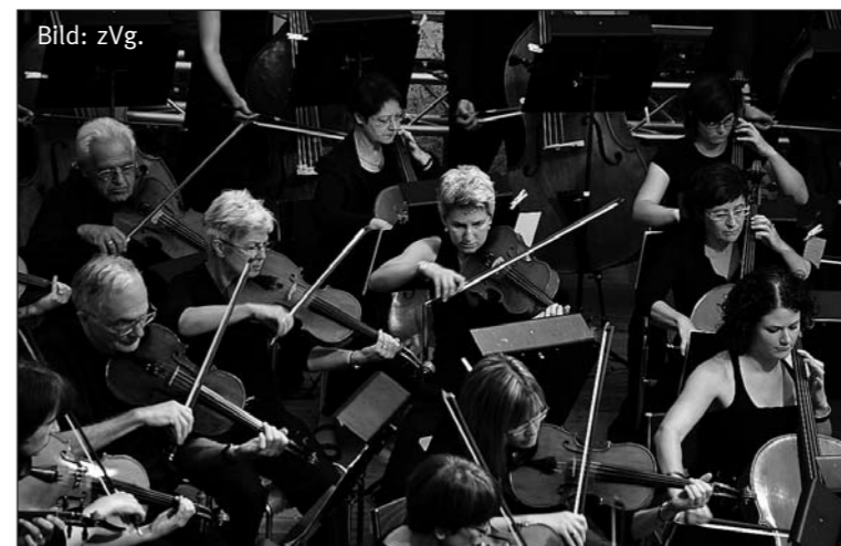
Für seinen homogenen Klang hat sich das Orchester in der ganzen Ostschweiz und dem angrenzenden Ausland viel Anerkennung erworben.

«The armed man – a mass for peace» ist das Ergebnis eines besonderen Auftragwerks der englischen «Royal Armouries» zur Jahrtausendwende. Zugleich ist es die jüngste von «armed man»-Messvertonungen, die das französische