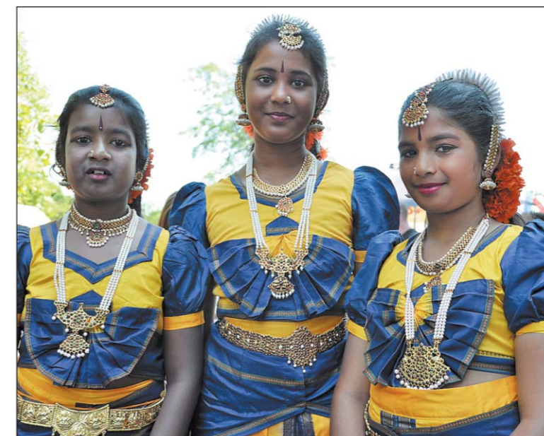
Am vierten Internationalen Kulturfest im Jakob-Züllig-Park erwartet die Gäste ein buntes Programm aus der ganzen Welt

Eine Gruppe des Ausländernetzes der Stadt Arbon wird mit der Unterstützung der Abteilung Soziales der Stadt Arbon das Internationale Kulturfest Arbon (IKA) durchführen. Dies ist eines der Projekte, welches im Rahmen des Migrationskonzepts der Stadt Arbon realisiert und morgen Samstag, 25. Mai, von 11 bis 20 Uhr zum vierten Mal beim Musikpavillon Jakob Züllig stattfinden wird.