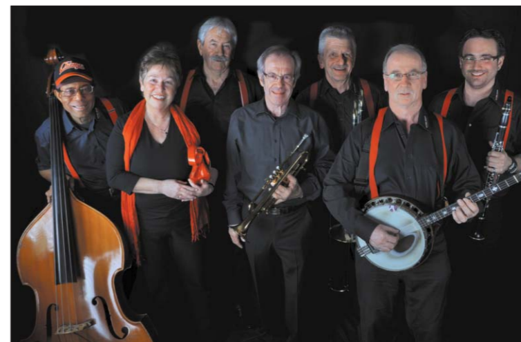
Mit der River-House Jazzband aus Rorschach ist Stimmung an der sonntäglichen Dixie-Matinée auf dem Arboner Fischmarktplatz garantiert.