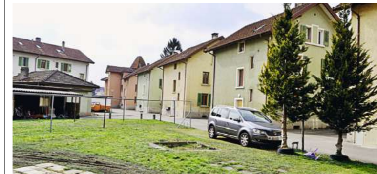
Der Heinehof, wie er sich heute präsentiert.

Die Arboner Arbeitersiedlung Heinehof an der Landquartstrasse spürt den Frühling. Die Besitzerin, AG für Städtisches Wohnen in St. Gallen, will die Arbeiterhäuser sanieren und die Siedlung dank Zwischenbauten neu zum Blühen bringen.