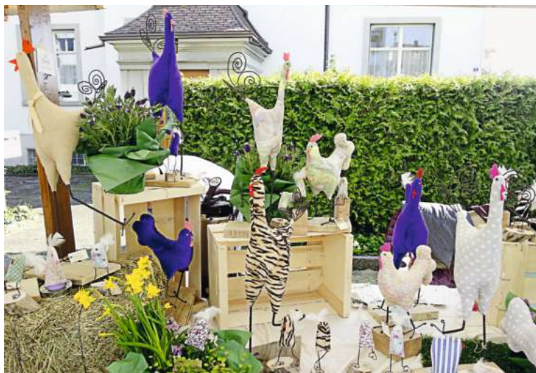
Der Arboner Ostermarkt findet morgen Samstag, 17. März, statt.

Wegen grosser Nachfrage hat das Infocenter das Marktareal erweitert und so werden die Stände dieses Jahr auf dem Fischmarktplatz, der Turmgasse und auf der Promenadenstrasse stehen.