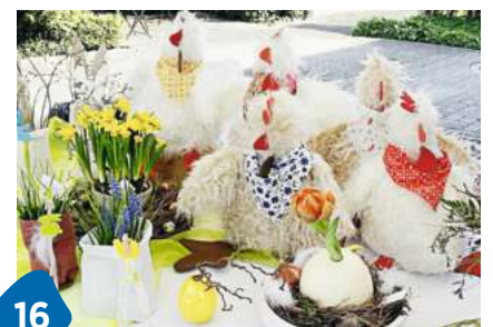
Neuheit bei Eugster