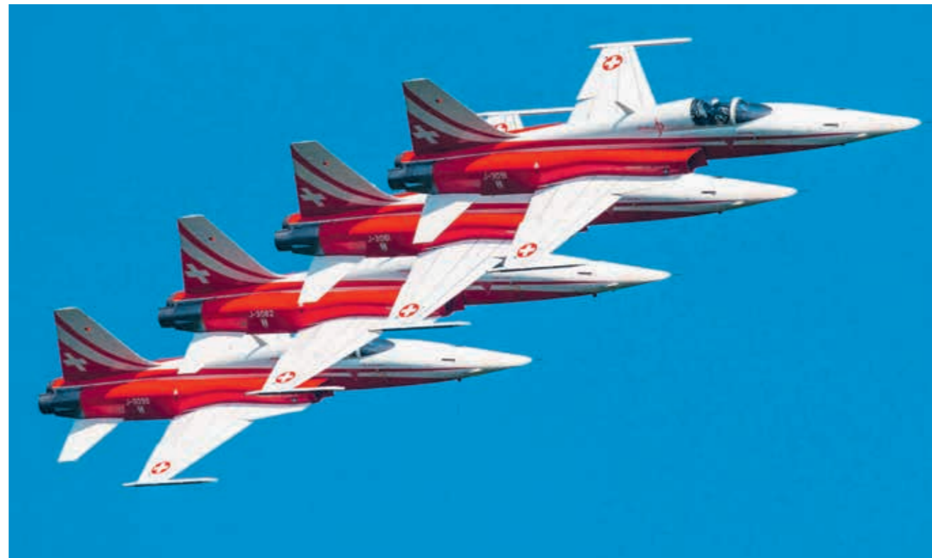
Flugshow mit der Patrouille Suisse – am Freitag, 4. Mai, wird ab ca. 15 Uhr trainiert, am Samstag, 5. Mai, ab 16 Uhr findet ein grossartiges Spektakel über dem Bodensee statt.

Die Patrouille Suisse, Oldtimer-Autos, Dampflokomotiven und Oldtimerschiffe: An den «arbon classics» vom 5. und 6. Mai erwartet die Besucher ein reichhaltiges Programm.