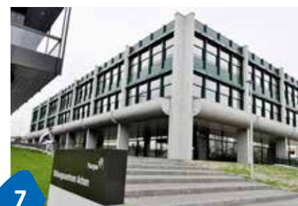
7 Offene Türen nach Sanierung