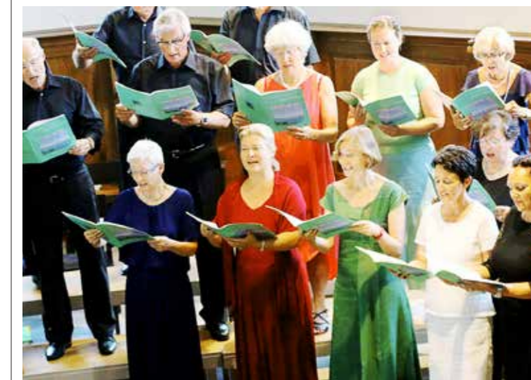
Intensive Klangfarben und passendes Outfit: Der Konzertchor Ostschweiz bringt zwei musikalische Werke zum Blühen.