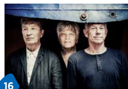
16 «The Nits» im Presswerk