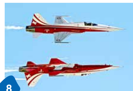
8 Spektakel über Arbon