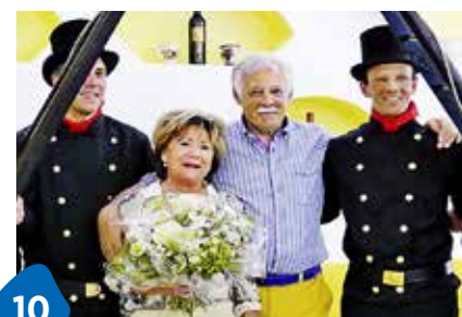
10 Kaminfegermeister im Glück