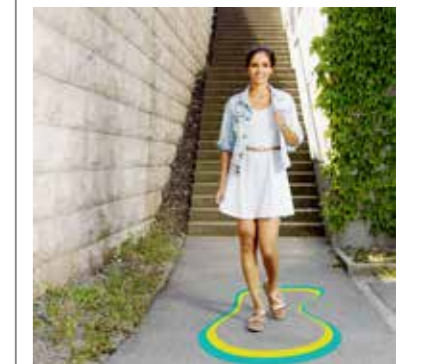
Egal ob klassisch oder trendig – dieses Jahr findet jeder einen Joya-Schuh nach seinem Geschmack – www.joyashop.ch pd.

Das Joya-Team Roggwil lädt zum Gesundheitstag mit Apéro am Samstag, 5. Mai, ein. Am Event – von 8.30 bis 16 Uhr an der Betenwilerstrasse in Roggwil – steht die neue Joya-Sommerkollektion und damit die Gesundheit im Fokus. Interessierte profitieren von persönlicher Beratung durch Joya-Spezialisten, können gratis eine individuelle Fussdruckmessung machen lassen, den einzigartigen Gehkomfort von Joya-Schuhen ausgiebig testen und Interessantes rund um das Thema gesundes Gehen, Rücken- und Fussgesundheit und Prävention erfahren.