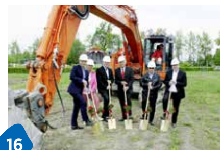
Wortteppich für Karten