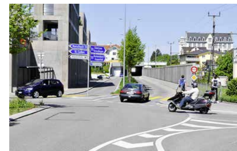
Die NLK beim Webschiffkreisel neben dem Bahnübergang.

Der Arboner Stadtrat hat die Schlussabrechnung für das Bauprojekt Neue Linienführung Kantonsstrasse (NLK) genehmigt. Dieses schliesst bei Minderkosten in der Höhe von rund 2,57 Mio. Franken. Genehmigt hat er auch die Schlussabrechnung für das Pumpwerk auf dem «WerkZwei»-Areal und die Kanalisation in der Stickereistrasse. Hier betragen die Minderkosten rund 120 000 Franken.