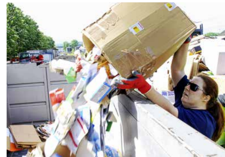
Das Sammelgut wird in den Bahnwagen geleert und danach durch die Amriswiler Firma Huber abgeholt und zur Wiederverwertung verkauft.

Mehr Papier landet im Werkhof Doch die Zeiten sind schwieriger geworden für die Vereine: Die Mengen an Altpapier sind rückläufig. Im Zeitalter von Internet und E-Mail ist weniger Papier im Umlauf. Vor allem aber entsorgt die Arboner Bevölkerung immer mehr Altpapier und Karton im Werkhof, statt es den Vereins-Papiersammlungen zu überlassen. Die Statistik der Stadt Arbon spricht eine eindeutige Spra-