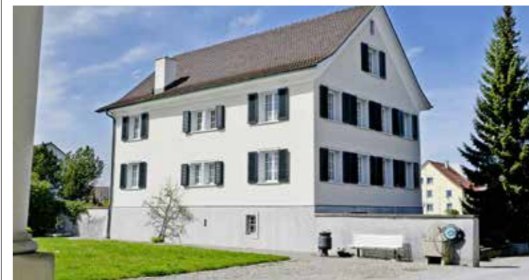
Das Steinacher Pfarrhaus erhält nach 40 Jahren für 1,17 Mio. Franken eine Innen-Sanierung bei anschliessend gleicher Nutzung.

Die kürzliche Kirchbürgerversammlung der katholischen Pfarrei Steinach stand im Zeichen der Renovationen. Bei den 66 Kirchbürgerinnen und Kirchbürger stiess das Renovationsprojekt des Pfarrhauses jedenfalls auf Interesse. Zumal natürlich 1,17 Mio. Franken kein Pappenstiel sind.