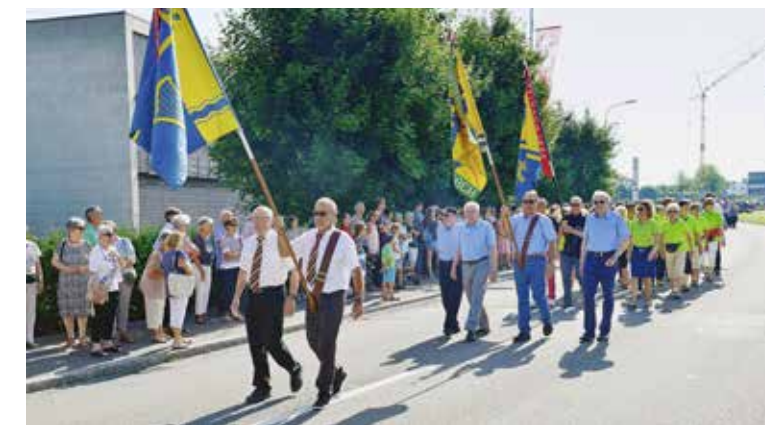
Einzug der Steinacher Vereine mit ihren Vereinsfahnen – auf dem Weg von der Bleichstrasse zur Fahnenweihe im Festzelt.

Strahlendes Wetter begleitete in Steinach die Musikvereine zum Kreismusiktag. Das Festmotto «Klangvolles Steinach» versprach nicht zuviel: Die Musik war im ganzen Dorf hör- und spürbar.