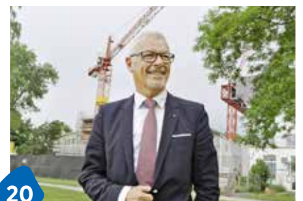
Steinach im Musikrausch