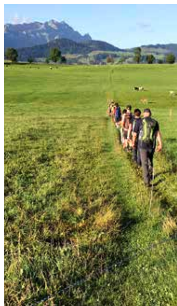
Der Säntisgipfel (im Hintergrund) ist noch weit, doch jeder Schritt zählt.

Minuten wieder alle weitermarschieren möchten – an Weissbad vorbei nach Wasserauen. Die Füsse schmerzen bei einigen schon sehr, so dass in Wasserauen fast alle ihre Trekkingschuhe ausziehen und sich Wanderschuhe anziehen. Bereits seit sieben Stunden sind die Wandersleute vom Bodensee unter-