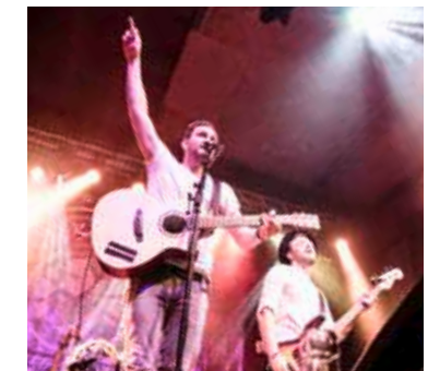
Kommen wieder: Saint City Orchestra bei ihrem Auftritt 2018.

Der Kulturverein «Presswerk» in Arbon ist bereit für die neue Herbstsaison mit viel heisser Live-Musik.