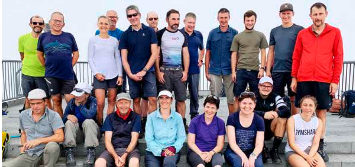
Ziel erreicht: Müde, aber glücklich präsentiert sich die 20köpfige Wandergruppe auf dem Säntisgipfel.

Dunkel, still und etwas mystisch ist es an diesem Samstagmorgen um 3 Uhr am Hafen von Steinach. Plötzlich treten aus verschiedensten Richtungen Personen in Wanderkleidern und mit Stirnlampen bestückt aus dem Dunkeln. Die Gruppe hat an diesem Tag ein Ziel: Gemeinsam zu Fuss vom Bodensee bis auf den Säntisgipfel wandern.