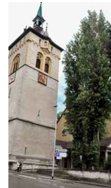
Das Pappel-Trio rechts der Martinskirche wird nächsten Dienstag gefällt.

um sich nach einem massiven Eingriff zu erholen und zu beruhigen, sollen zwischen Fällung und Neube-pflanzung etwa vier Monate Ruhezeit eingeplant werden. Deswegen sei der September ein gut gewählter Zeitpunkt für die Fällung.