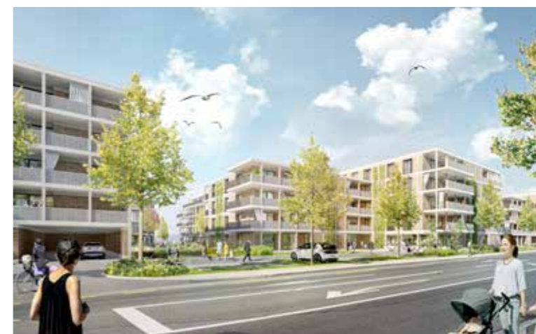
Die Besucherparkplätze des «Arrivée» befinden sich zur Seestrasse hin.

Immobilienentwickler bei «Mettler2Invest», betonte, die Vermietung dieser Gewerbeliegenschaften gestaltet sich oft als schwierig. Mit der Auslagerung in ein separates Bau- feld könne auf Bedürfnisse möglicher Mieter besser eingegangen werden. Interessenten seien bereits vorhanden. Ein konkretes Projekt gäbe es jedoch noch nicht. Weshalb auch im Gestaltungsplan noch kein Gebäudekomplex eingezeichnet ist, sondern lediglich die Fläche für ein solches