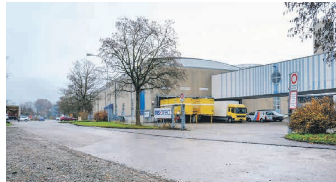
Die Zufahrt zum neuen MS Direct-Standort, die über den Parkplatz des Seeparksaals erreichbar ist.

Das Logistikzentrum des MS Direct-Standorts in Arbon zieht im nächsten Jahr in die leer stehenden Hallen oberhalb des Seeparksaals um. Damit werden 150 neue Arbeitsplätze geschaffen. Und der Verkehrsbetrieb in Richtung Arboner Altstadt erhöht.