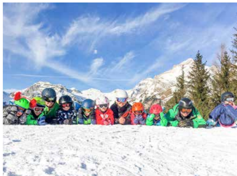
Rund 50 Leiterinnen und Leiter bringen den Teilnehmenden in Wildhaus Ski und Snowboard fahren bei und feilen an der Fahrtechnik.