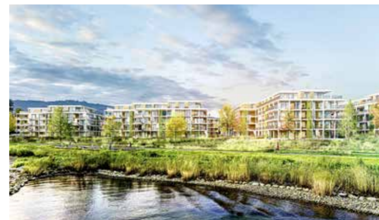
Dünenartig soll die Landschaft zwischen See und «Arrivée» ausgestaltet werden.