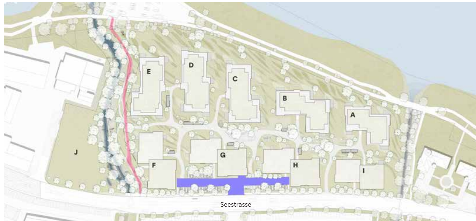
Der Gestaltungsplan Bachgallen Ost zeigt die Anordnung der neun Wohnhäuser (A bis I) sowie die Fläche, welche für gewerbliche Nutzung ausgewiesen wird (Baufeld J). Wie dieses ausgestaltet werden soll, hängt von den Bedürfnissen möglicher Mieter ab. Der Schwärzibach wird revitalisiert. Daneben verläuft ein Fuss- und Veloweg (rot markiert). Die Verkehrserschliessung erfolgt über die Seestrasse (violett markiert).