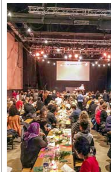
Arbonerinnen und Arboner feiern im «Presswerk» gemeinsam Weihnachten.