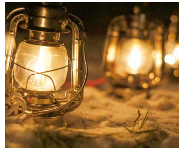
Ob auf dem 1.6 Kilometer langen Laternliweg auch dieses Jahr Schnee liegen wird, weiss erst Petrus.

Am Freitag, 16. Dezember, und Samstag, 17. Dezember kann zwischen 17 und 22 Uhr ein mit Laternen beleuchteter Spaziergang durch den Tälisberg Wald unternommen werden. Unterwegs warten am Wegrand weihnachtliche Überraschungen. So können an einem Bastelstand Laternen kreiert werden. Ausserdem warten vier Roggwiler Familien entlang dem Weg und begrüssen die Besuchenden mit Gesang und Geschichten, die auf Weihnachten einstimmen. Vor dem Schützenhaus Tälisberg, welches Startpunkt der Route ist, stehen Parkplätze zur Verfügung. Zudem wird dort ein Festplatz mit Verpflegung eingerichtet. pd.