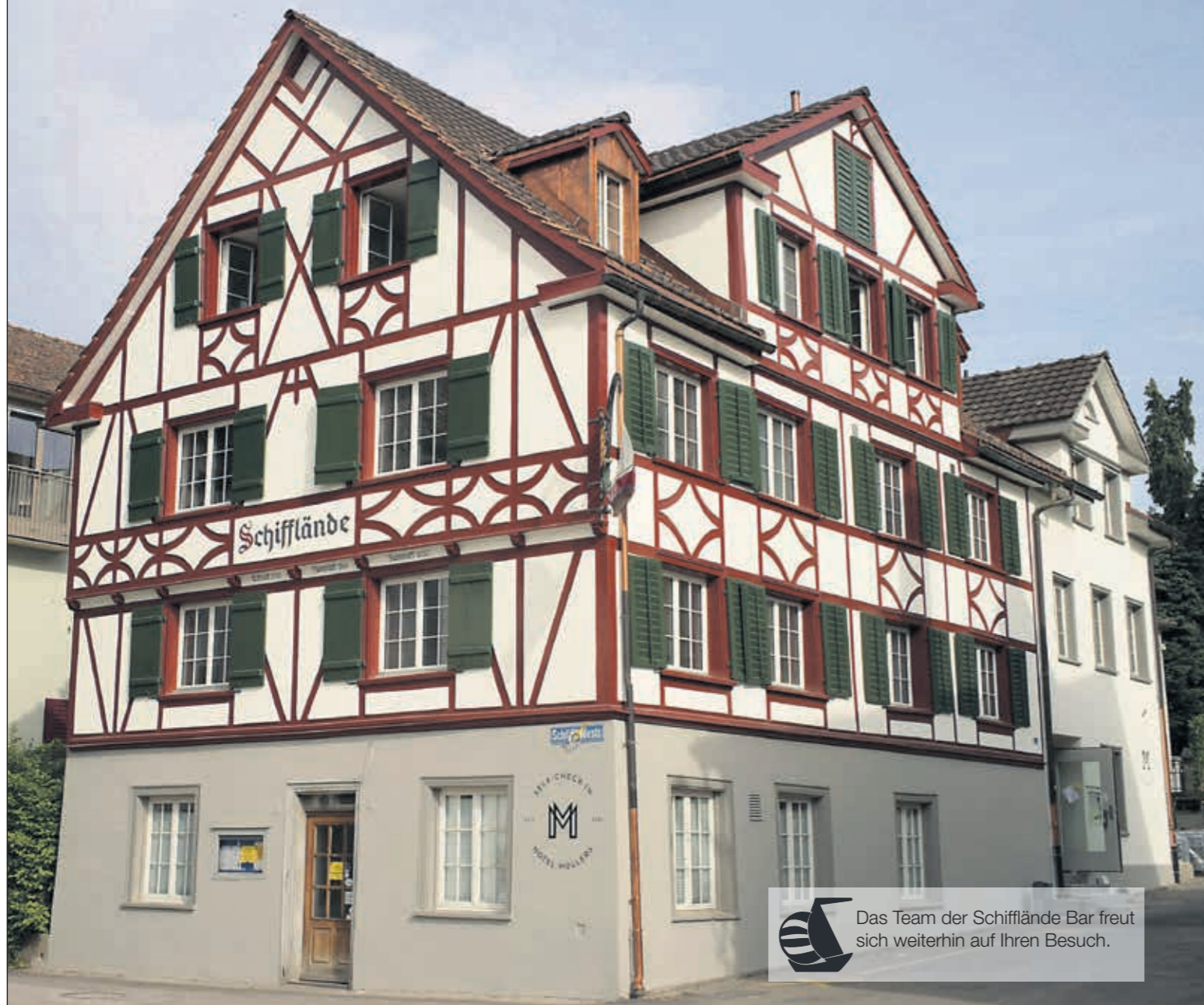
Das Team der Schiffplände Bar freut sich weiterhin auf Ihren Besuch.

TAG DER OFFENEN TÜR BESUCHEN SIE UNS AM 11. JUNI 2022 an der Hafenstrasse 6, Arbon ab 11.00 - 16.00 Uhr