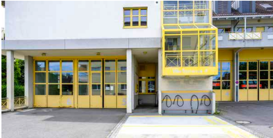
Die Räumlichkeiten für den Pilot der Steinacher Tagesbetreuung sind im Feuerwehrdepot untergebracht.

Steinach baut das Angebot für die ausserschulische Betreuung aus. Die Bürgerschaft hat mit dem Budget 2022 einen Pilotbetrieb gutgeheissen, der nach den Sommerferien startet. Mit der Umsetzung des Pilots hat die Gemeinde die Fiorino AG beauftragt.