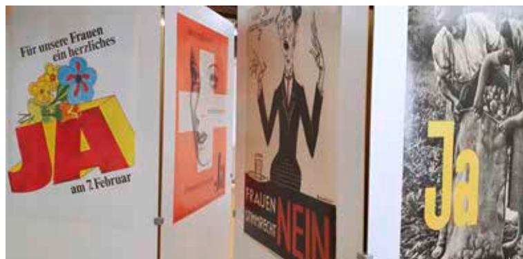
Abstimmungsplakate werben für oder gegen das Frauenstimmrecht.