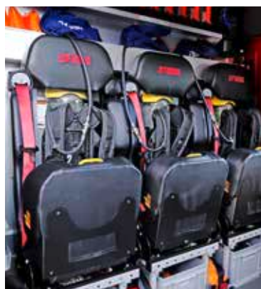
Das neue Fahrzeug ist zweigeteilt: Vorne Mannschafts- hinten Materialwagen. Insgesamt 900 Kilogramm Material befinden sich im Fahrzeug.