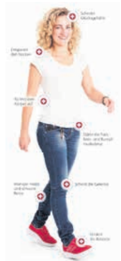
Wohlthuende Entlastung - dank kybun Joya

lange stehen. Die Luftkissen-Sohle verhindert schwere Beine, brennende Füße, Rückenschmerzen und Venenprobleme. kybun Joya empfiehlt sich besonders bei Fussproblemen, wie Hallux oder Fersensporn, da das weich-elastische Material sich immer dynamisch an die Form der Fusssohle anpasst.