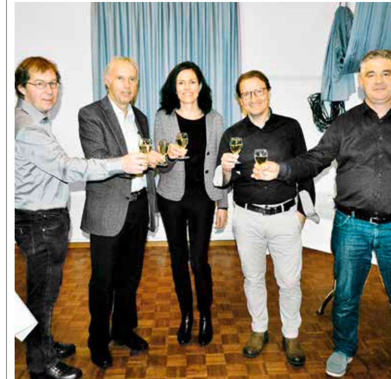
Der Roggwiler Gemeinderat – fotografiert nach der Wahl im Jahr 2019 – hat erneut Grund zum Anstossen. Der Rechnungsabschluss ist positiv. (Archivbild)