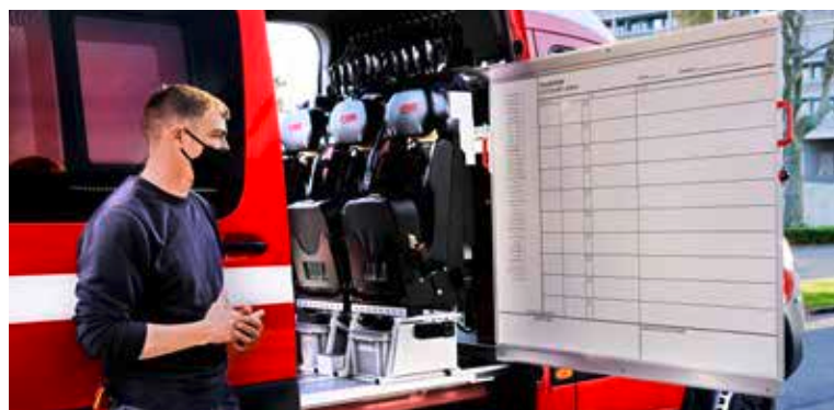
Das Highlight des Atemschutz-Fahrzeugs ist die ausziehbare Truppenüberwachungstafel. Sie ist auch Grund für die Lieferverzögerung. Der Auszieh- und Arretiermechanismus ist eine Spezialanfertigung und verzögerte sich Corona-bedingt.