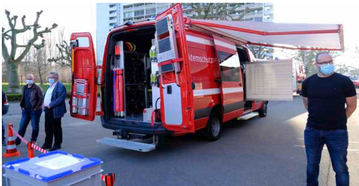
Der Arboner Feuerwehr-Kommandant Felix Perrone (rechts) vor dem neuen Atemschutz-Fahrzeug. 220 000 Franken kostete die Anschaffung. Der Einsatzwagen ist «gespiegelt», das heisst, Ruheraum und Einsatzpool (unter der Markise) können auf beiden Seiten aufgebaut werden. «Wir haben viel fürs Geld bekommen», freut sich Perrone.

Gleichzeitig nutzte sie die Gelegenheit, um die neuen Abläufe in der Einsatzhygiene vorzuführen. Neu wird die beim Einsatz getragene Kleidung und das benutzte Material strikt vom Rest getrennt. So soll verhindert werden, dass krebserregende Substanzen über den Einsatzort hinaus verschleppt und eingatmet werden. «Es ist eine aufwändige Prozedur, aber hygienemässig ein grosser Fortschritt», erklärt der Arboner Feuerwehr-Kommandant Felix Perrone.