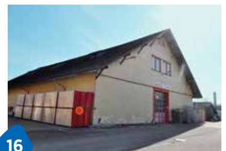
Steinach behebt Brandfolgen