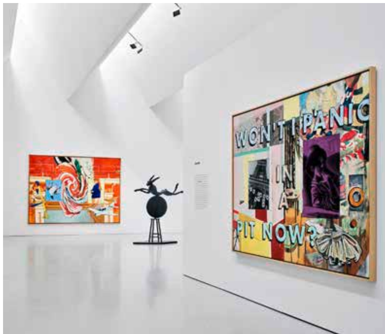
Die Ausstellung «Lust auf mehr» im Würth Haus Rorschach hat letzte Woche eröffnet und läuft noch bis im Februar 2023.

Rund 45 Werke zeitgenössischer Kunst sind aktuell im Würth Haus Rorschach zu sehen. Die Sammlungsausstellung zeigt eine Bandbreite internationaler KünstlerInnen, die insbesondere in den 1980er- und 1990er-Jahren wegweisend waren. Grossen Raum nehmen dabei die US-Amerikaner ein. Darunter Künstler wie John Baldessari, David Salle und Frank Stella. Doch auch Positionen aus Deutschland, unter anderem von Gerhard Richter, Neo Rauch, Jörg Immendorff und Markus Lüpertz sind vertreten. Die Ausstellung läuft noch bis zum 12. Februar 2023.