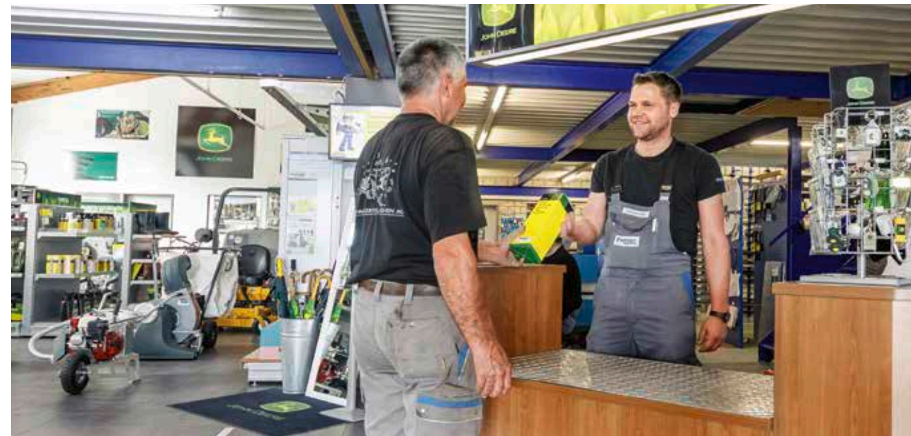
Die Forrer Landtechnik AG sieht sich auch als Anlaufstelle für fachkundige Beurteilungen: Lohnt sich eine Reparatur? Gibt es Ersatzteile? Im Zweifelsfall können Kunden ihre defekten Gerät einfach unverbindlich begutachten lassen.