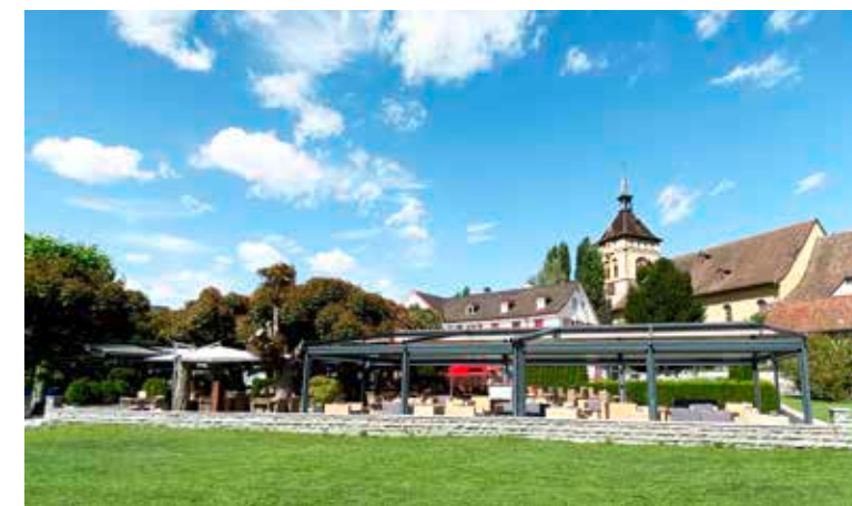
Die Pergolen des «Roten Kreuz» dürfen vorübergehend genutzt werden.

Die Massnahmen zur Eindämmung der Corona-Pandemie treffen die Gastronomie besonders hart. Vor diesem Hintergrund hat der Arboner Stadtrat beschlossen, den Vollzug des Nutzungsverbots beim Hotel-Restaurant Rotes Kreuz teilweise auszusetzen.