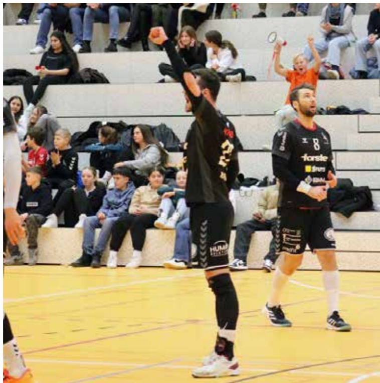
Viel Grund zum Jubeln: Beim HCA läuft's zurzeit wie am Schnürchen.