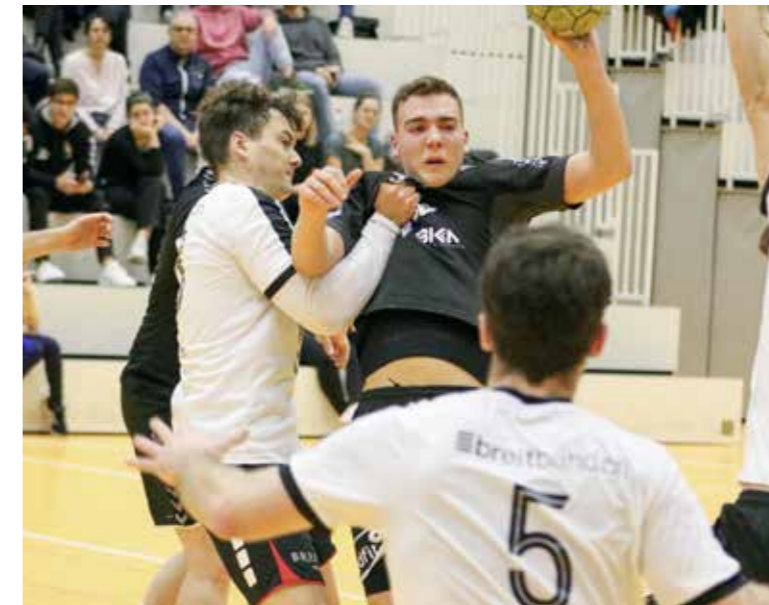
Obwohl der Aufstieg gesichert ist, besteht für die Herren des HC Arbon kein Grund, sich auf ihren Lorbeeren auszuruhen. Auch diesen Samstag werden sie in der Sporthalle Arbon ihr Bestes geben.

Damen gegen Rotweiss Thun Nachdem letzte Woche das Spiel gegen die US Yverdon abgesagt werden musste, sind die Arbonerinnen hungrig auf den nächsten Ernstkampf. Am Samstag, 1. April, um 19 Uhr wird die SPL1-Mannschaft des DHB Rotweiss Thun in der Arboner Sporthalle willkommen geheissen. Mit 6 Punkten aus den bisherigen sieben Partien besteht für die Damen des HC Arbon