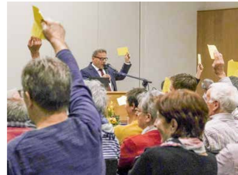
Angenommen: Beim Budget 2023 waren sich die Bergerinnen und Berger einig.