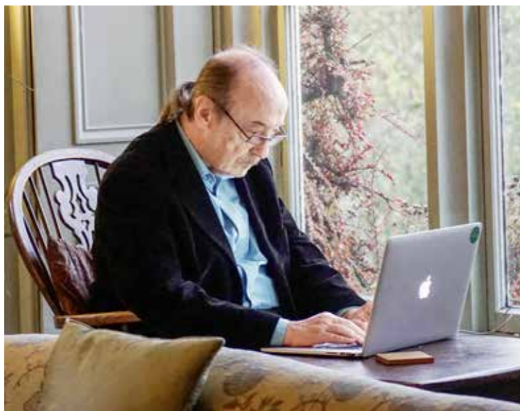
Es gibt einfache Methoden, Online-Kriminelle zu entlarven.