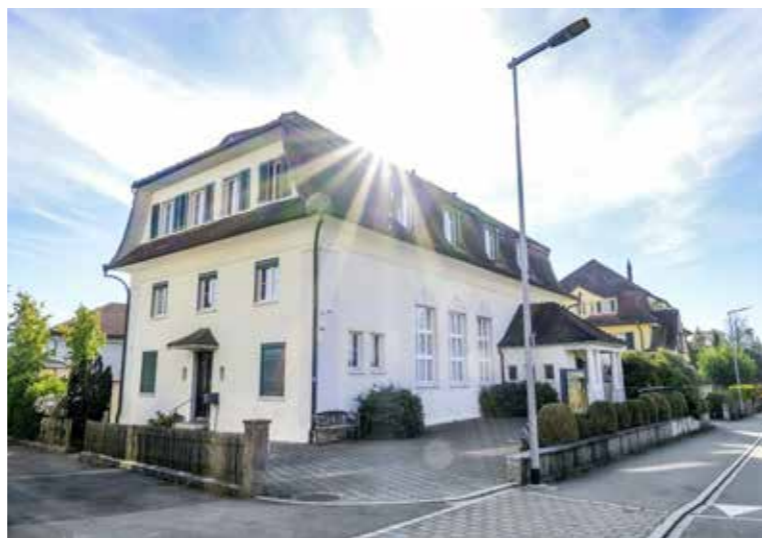
Soll das Platzproblem der PSG Arbon beheben: das Haus an der Römerstrasse 29.

Weitere Herausforderungen liegen laut der Schulbehörde im dynamischen Umfeld. Doch trotz vielen noch ungewissen und nicht beeinflussbaren Faktoren, wie die Energiemangellage, sei es wichtig, den Lehrpersonen einen unterstützenden und zeitgemässen Arbeitsplatz zur Verfügung zu stellen. Für 2023 ist deshalb geplant, alle Klassenzimmer im Schulhaus Stacherholz mit