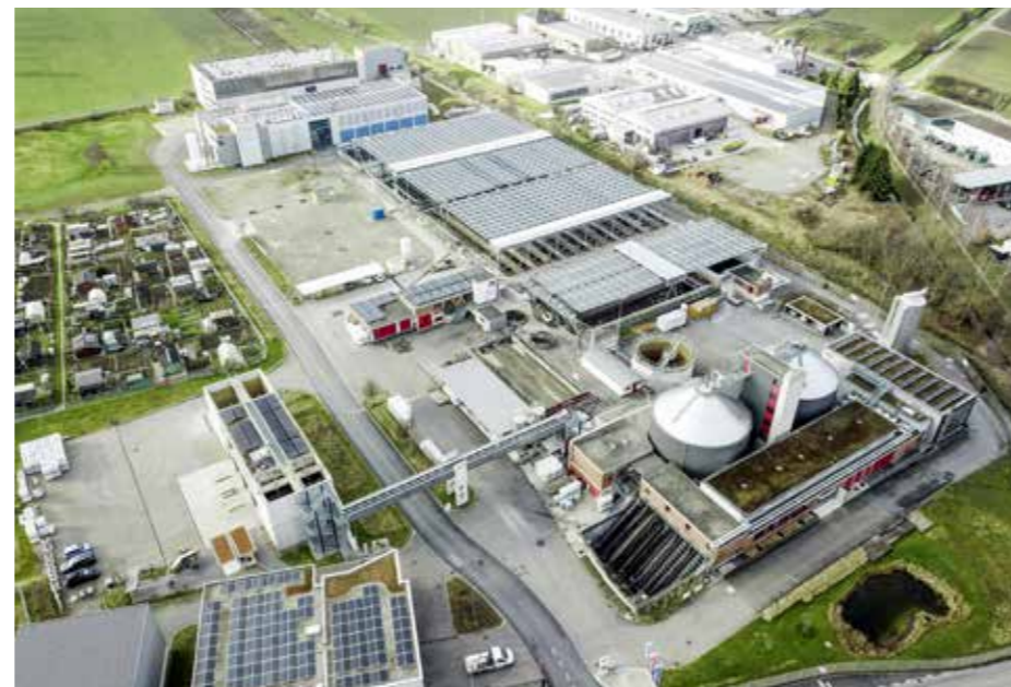
Eine Stromkontingentierung hätte auch Folgen für den Betrieb der ARA Morgental.