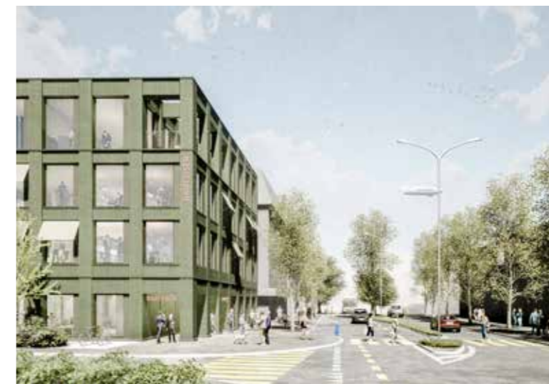
Die Visualisierung zeigt das Neubauprojekt am jetzigen Raiffeisen-Standort in Arbon.