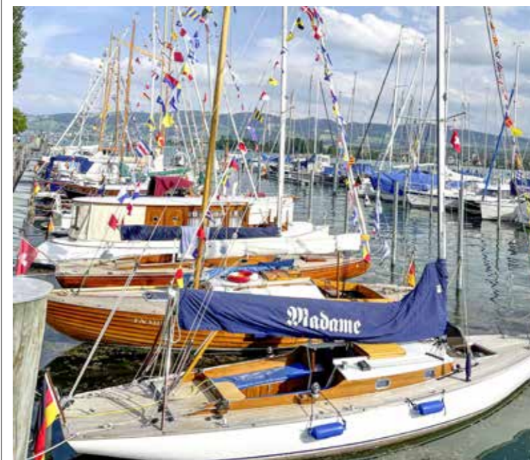
Die Teilnehmenden des neuen Anlasses «Classics-Nautica-Arbon» sollen im Mai 2023 den Arboner Hafen mit Oldtimer-Charme und Leben erfüllen.

Die Veranstalter der «Arbon Classics» warten mit einem neuen Format auf, das nicht nur Arbon als Hafenstadt bekannter machen, sondern auch die Pausenjahre zwischen zwei Durchführungen verkürzen soll.